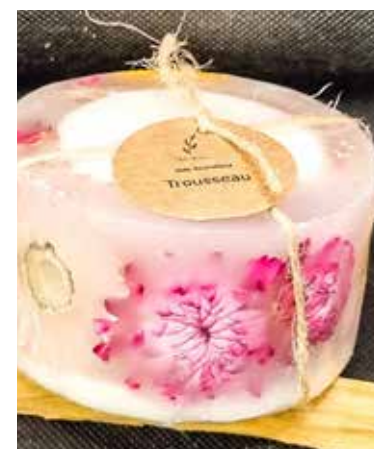
Ateliê Mari Martins

O Bazar é uma ótima oportunidade para quem quer apoiar um mercado