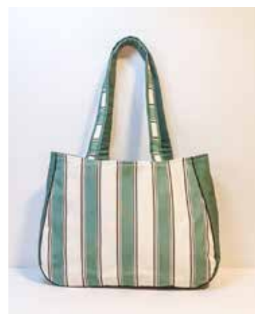
Ateliê Menina Boneca

cessaires, o ateliê traz uma proposta diferenciada para garotas: produz vestidos infantis para a menina e outro igualzinho para boneca, formando uma dupla cheia de charme e estilo.