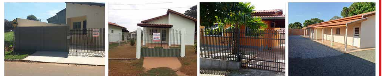
- IMIGRANTES - Cod. 453 - BORDA DA MATA - Cod. 465 - IMIGRANTES - Cod. 450 - RINCÃO (STO ANT. POSSE) - Cod. 564