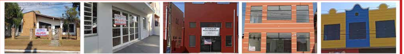
- CENTRO - Cod. 558 - JD DAS TULIPAS - Cod. 546 - JD DAS TULIPAS - Cod. 561 - MORADA DAS FLORES - Cod. 550 - MORADA DAS FLORES - Cod. 559