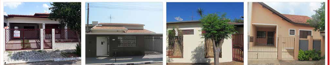
- JD DAS TULIPAS - Cod. 457 - JD DAS TULIPAS - Cod. 527 - JD DAS TULIPAS - Cod. 417 - GROOT - Cod. 555