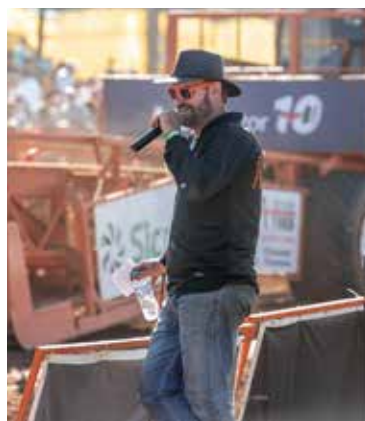
- Os locutores do Trekker Trek